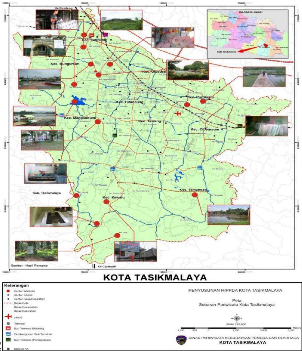
Gambar 3. 10 Peta sebaran Objek dan daya Tarik Wisata Kota Tasikmalaya