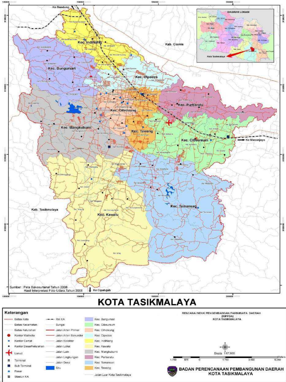
PETA ADMINISTRASI KOTA TASIKMALAYA